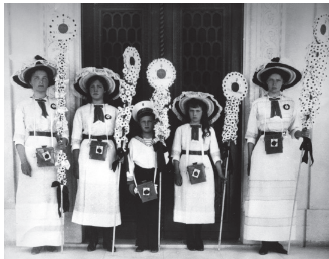
Дети императора Николая II в день «Белого цветка». Ливадия, 1912 г.

В празднике «Белого цветка» принимали участие все слои населения. В каждой семье что-то мастерили, вручную изготавливались десятки тысяч цветков и передавались в комитеты «Белого цветка». Курсистки — слушательницы Высших женских курсов и Женского медицинского института — забирали букеты и расходились по всему городу. Организаторы особенно подчеркивали то, что ценен каждый пятак. Прейскуранта на букеты не было — каждый давал сколько может; и за копейку, и за рубль полагался одинаковый букет. Отчет о собранных средствах и их использовании печатался в газетах.