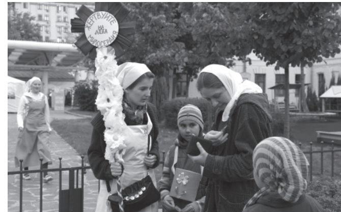
Шесты с белыми цветами и коробочки для сбора денег изготавливаются с детьми заранее. «Белый цветок» в Марфо-Мариинской обители, 2011 г.

Не дожидаясь, пока событие приобретет городской размах, можно провести день «Белого цветка» в своем приходе или в школе. Для этого необходимо рассказать детям о «Белом цветке» и попросить их подготовить для благотворительной ярмарки работы с символикой акции — белым цветком. Это могут быть поделки, мягкие игрушки, изделия из природного материала, вязание, вышивка, картины и т. д. Можно загодя провести мастер-классы и занятия с детьми, помогая им в изготовлении работ. Например, московские добровольцы вместе с детьми расписывали ромашками недорогие кружки. В вестибюле одной школы добровольцы-родители провели мастер-класс по изготовлению белых цветков. Под руководством консультантов каждый желающий мог изготовить цветок из обычной белой бумаги и ниток. В течение нескольких часов дети сделали более 170 цветков. Также можно подготовить исторические открытки или фотографии этого праздника с участием царской семьи.