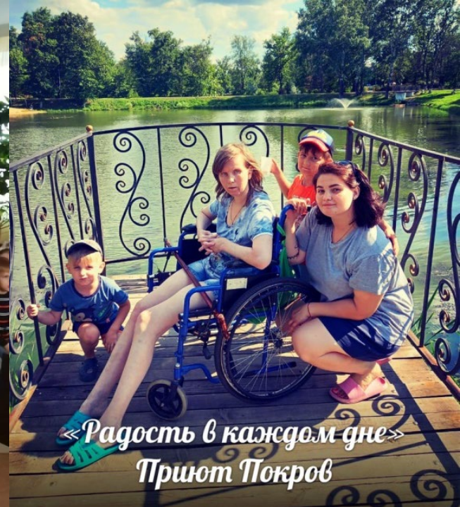
«Радость в каждом дне» Приют Покров