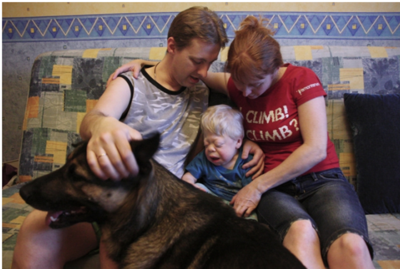
Фотовыставка «Меньшинства» в Сахаровском центре